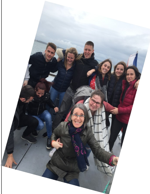
Vers Jersey ...