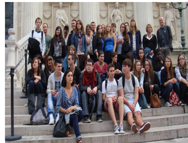
Visite de l'Opéra de Paris