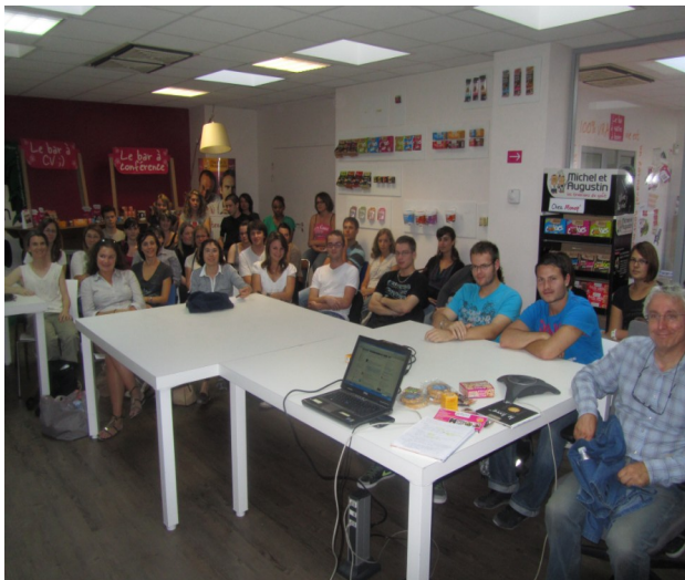
Michel & Augustin